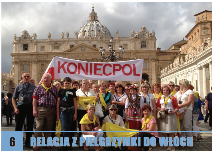
6 RELACJA Z PIELGRZYMKI DO WŁOCH