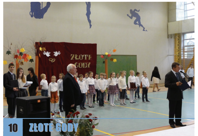
10 ZŁOTE GODY