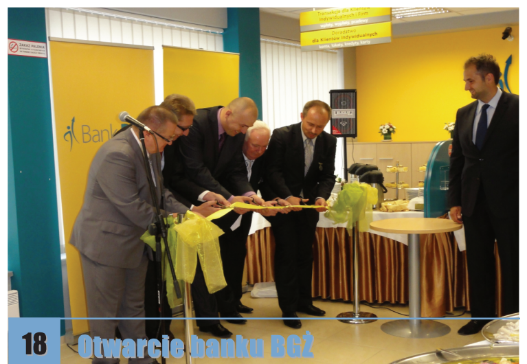
18 Otwarcie banku BGŻ