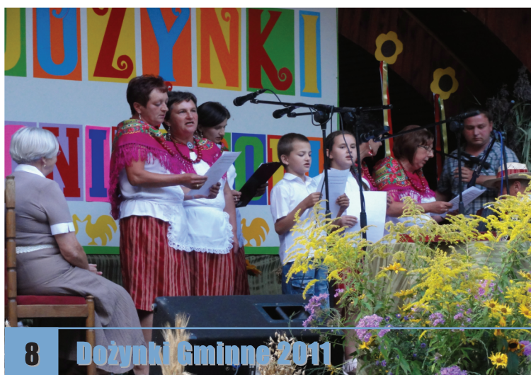
8 Dożynki Gminne 2011