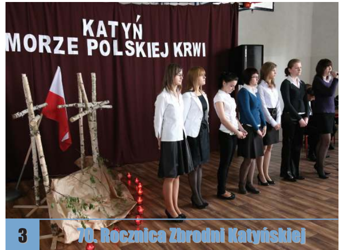
3 70. Rocznica Zbrodni Katyńskiej