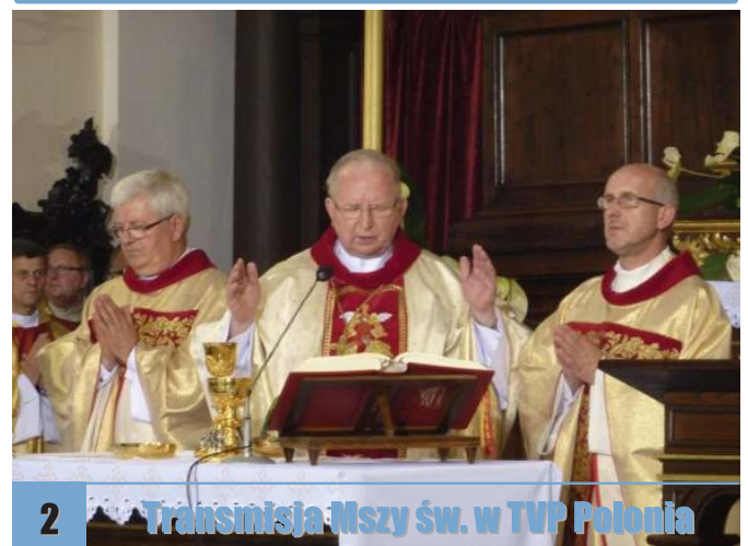
2 Transmisja Mszy św. w TVP Polonia