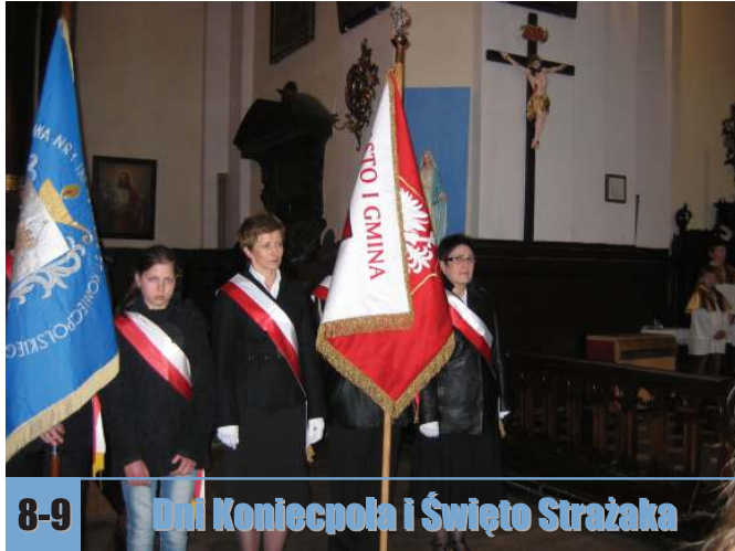
8-9 Dni Koniecpola i Święto Strażaka