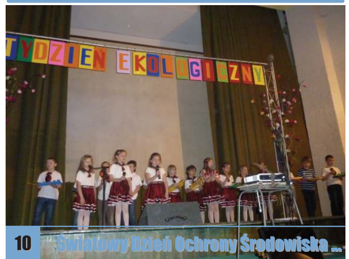
10 Światowy Dzień Ochrony Środowiska