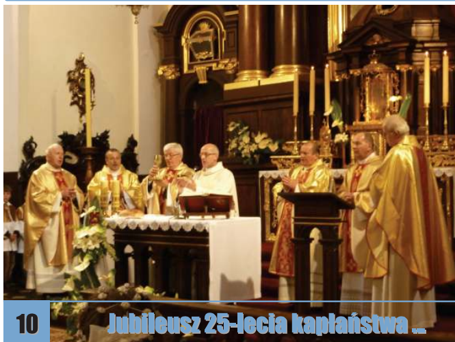
10 Jubileusz 25-lecia kapłaństwa ...