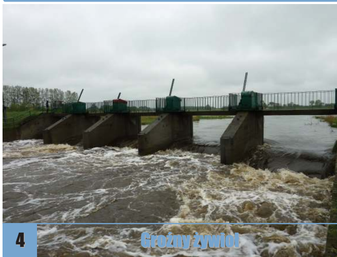
4 Groźny żywioł