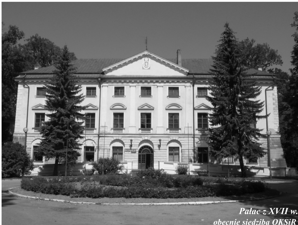
Pałac z XVII w. obecnie siedziba OKSiR

Władze carskie, chcąc ukarać Polaków za udział w powstaniu, postanowiły zlikwidować resztki autonomii w Królestwie Polskim. 338 miast Królestwa Polskiego zamieniono na osady. Represje te nie pominęły Koniecpola. W 1870 roku Koniecpol utracił prawa miejskie. Przywrócono je dopiero w 1927 roku. Szczególnie korzystne warunki dla rozwoju miasta zaistniały w 1903 roku, gdy uruchomiono linię kolejową łączącą Kielce z Częstochową. W okresie międzywojennym