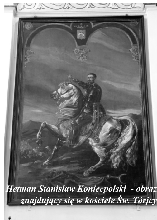
Hetman Stanisław Koniecpolski - obraz znajdujący się w kościele Św. Tójcy